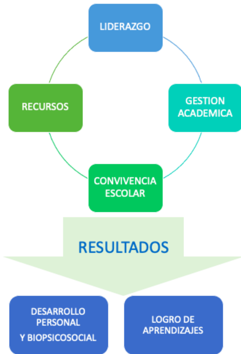
IMAGEN DEL MODELO DE GESTIÓN